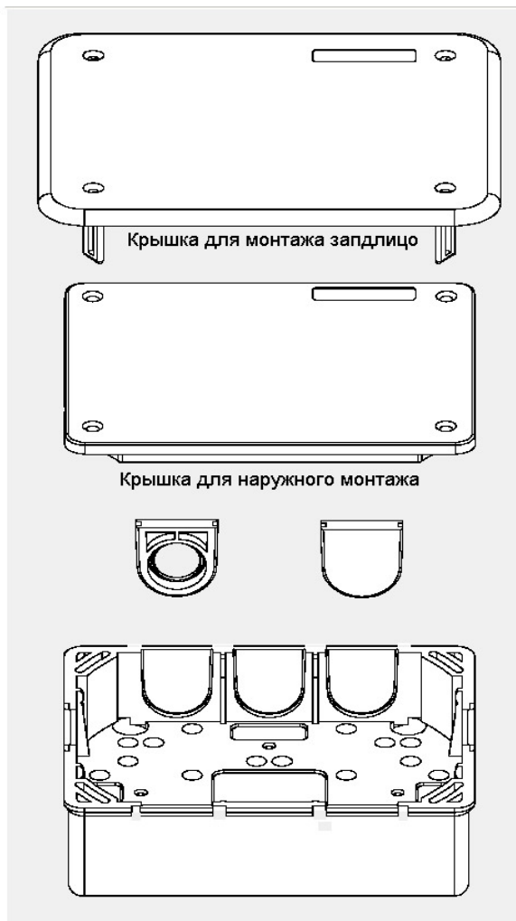
Рис. 1 DOS 816 с крышкой и кабельными входами

В этом случае DOS 816 крепится четырьмя винтами. Кабели и трубы устанавливают на поверхности или заподлицо. Для кабельных и трубчатых вводов на кромке коробки предусмотрены предварительно намеченные участки, которые можно выломать при установке на поверхности. Кабели или трубы можно тогда подвести точно в коробку по направляющим. Кроме того, кабели можно закрепить кабельными хомутами (по выбору). При необходимости крышку коробки прикрепляют к основанию винтами.